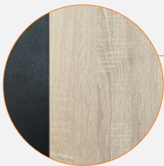
Tapa en MDP enchapada en melamínico

DECILE NO AL SEDENTARISMO Pasar largas horas sentado puede tener un impacto negativo en la postura, la circulación sanguínea y la salud en general. Al poder alternar entre diferentes posiciones, como estar de pie durante parte del día, se reducen los riesgos asociados con el sedentarismo prolongado. Además, trabajar de pie puede mejorar la postura, fortalecer los músculos y aliviar la tensión en la espalda y el cuello.