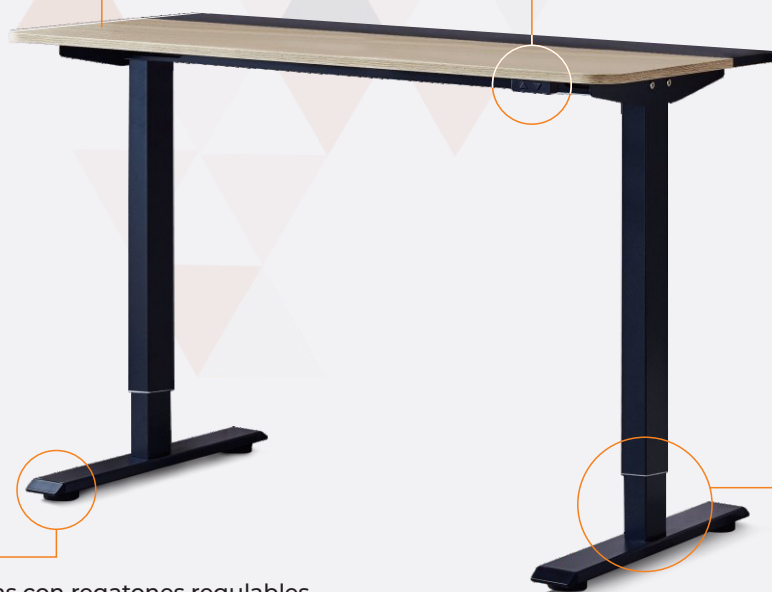
Estructura metálica con patas telescópicas