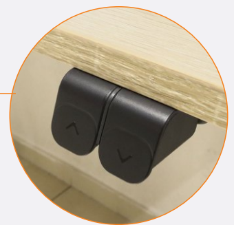
Botonera Sube Baja