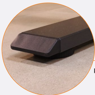
Patas con regatones regulables